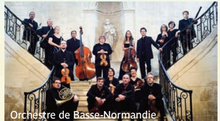
Orchestre de Basse-Normandie

Chorale américaine Valencia Choir - Entrée Libre