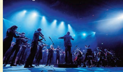
Peak String Orchestra

non lucratif, a pour objectif de soutenir et promouvoir la pratique musicale des jeunes de la région du North West Derbyshire en Angleterre.