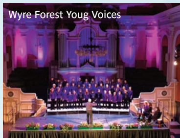
Wyre Forest Young Voices

Inscriptions indispensables à l'office de Tourisme - Gratuit - Nombre de places limité à 25 - Tél. : 02 31 97 30 41.