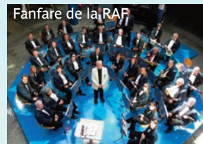
Fanfare de la RAF