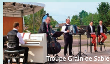
Troupe Grain de Sable